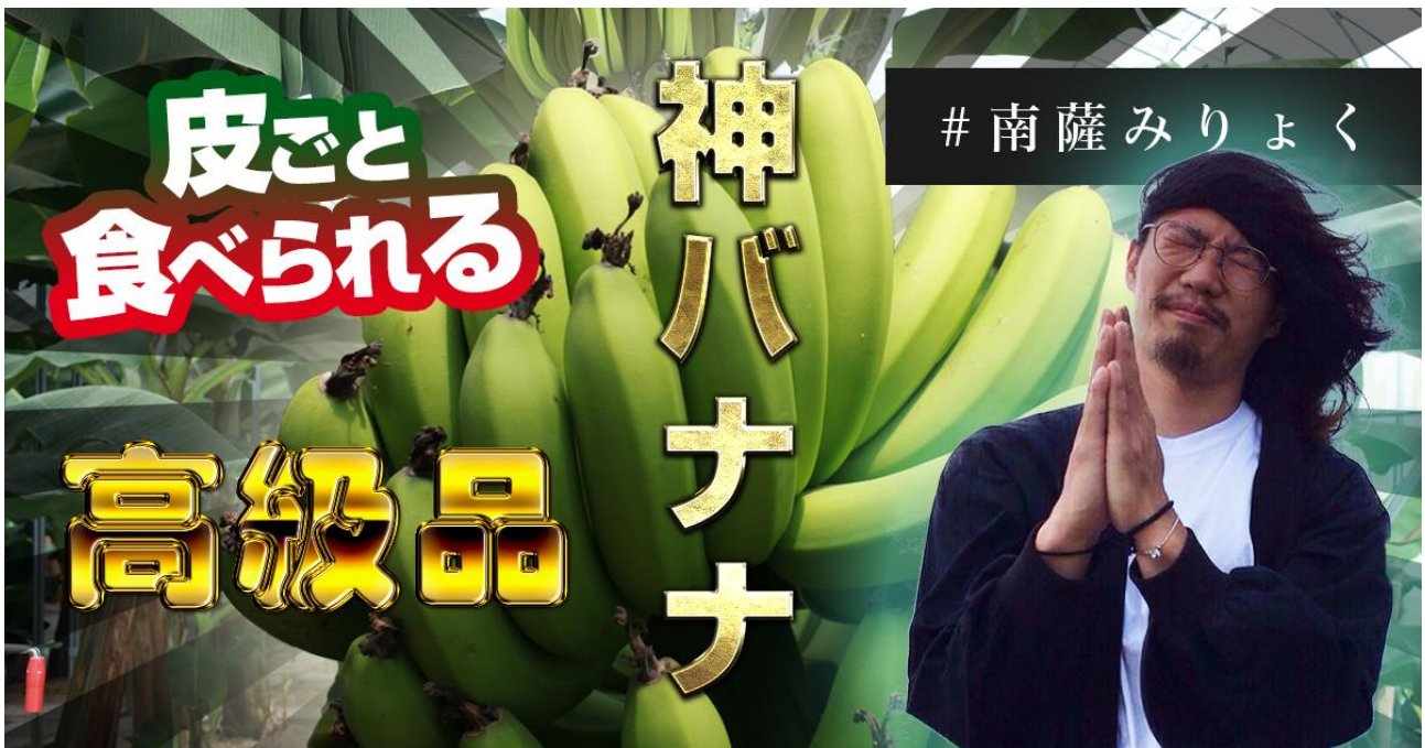
↑ 記事サムネイル画像