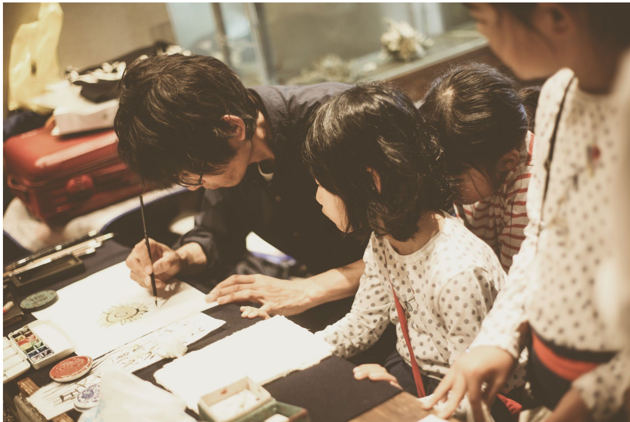
↑いせえび荘内ロビーで開催された書道 WS の様子

ひとまず、雨予報で開催すべきか否かの判断はどうだったのか。荒天で海側の景色はすこぶる悪く、“絶景祭り”にはふさわしくない状況。スタッフのモチベーションは下がっており、良い空気ではなかったように思います。今回と同じような大幅縮小開催でいくのならば、次回の雨での開催は辞めた方がいいと思います。