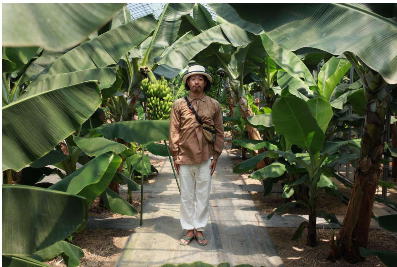
↑ 神バナナ株式会社内撮影