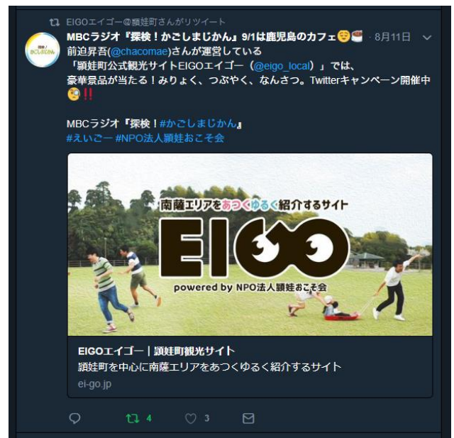
↑ 番組公式 Twitter で告知いただいた投稿