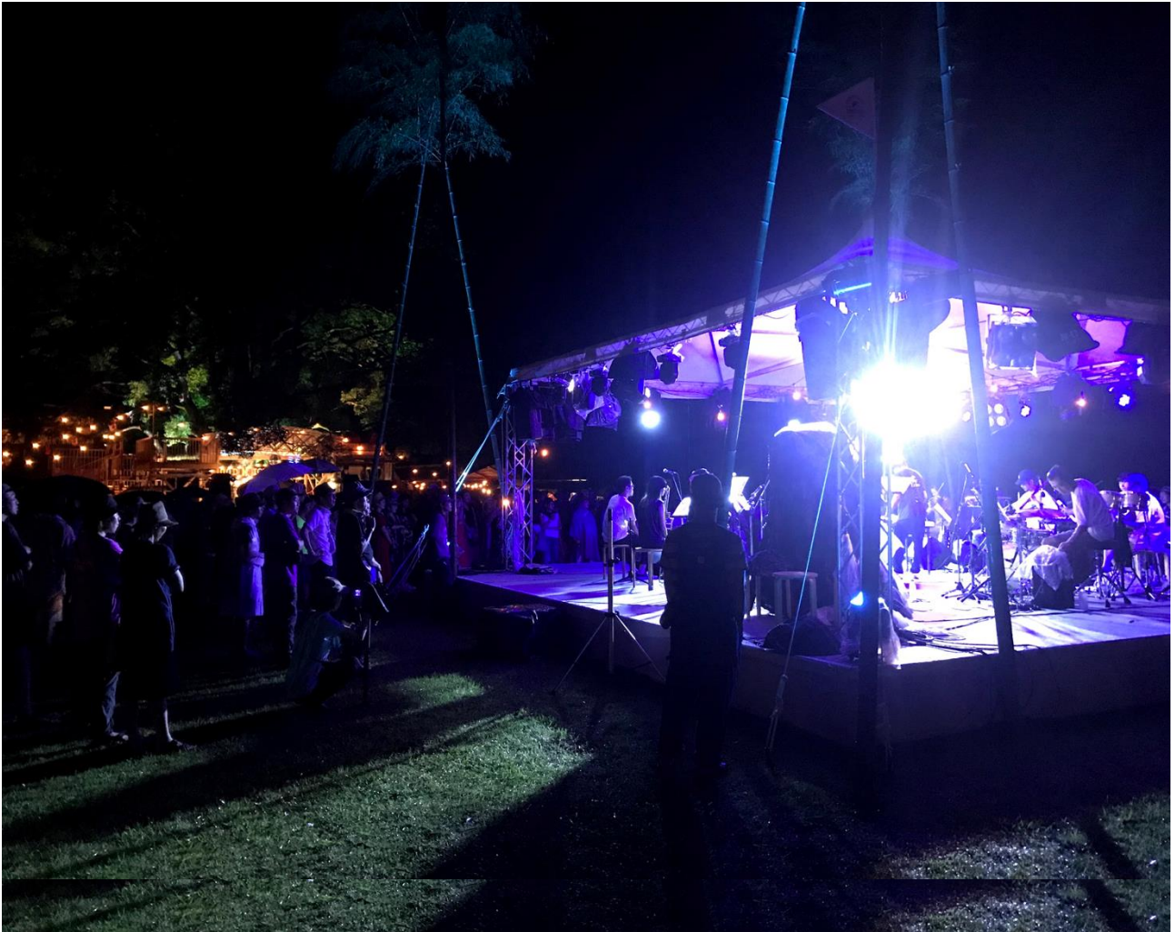
↑雨のなか、幻想的な光景を作り出すステージ。夢のような一日でした。