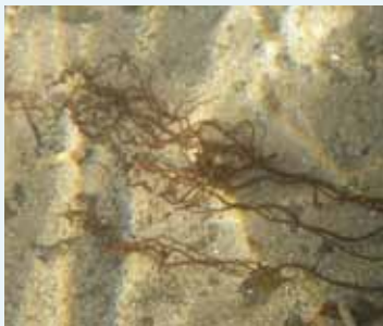
▲旧勝目郵便局前あたりから中山田下之口を中心とした麓川用水路で多く見られます。

中山田では2006年に発見され、株数の増減はあるものの毎年生育が確認されていることから今回指定されました。 年によって発生時期に幅がありますが、2月から5月くらいまで観察することができます。