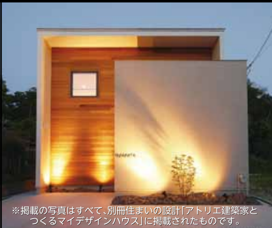
※掲載の写真はすべて、別冊住まいの設計「アトリエ建築家とつくるマイデザインハウス」に掲載されたものです。