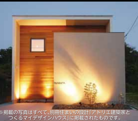
※掲載の写真はすべて、別冊住まいの設計「アトリエ建築家とつくるマイデザインハウス」に掲載されたものです。