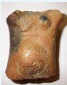
▲上加重田遺跡出土の土偶

■開催日 1月19日(土) ~ 3月24日(日) ※休館日 水曜日 ■場所 ミニミュージアム知覧