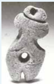
▲上加重田遺跡出土の岩偶

各種相談会についてのお問い合わせは、知覧保健センター (0993-58-7221) へお願いします。 (詳しい日程は、広報紙「くらしのカレンダー」でご確認ください。)