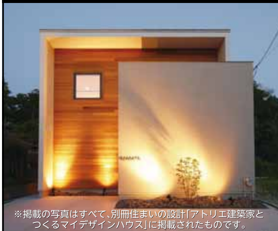
※掲載の写真はすべて、別冊住まいの設計「アトリエ建築家とつくるマイデザインハウス」に掲載されたものです。