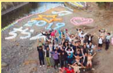
あかりの道標 「ちらん灯彩路」 ～紙灯ろうの完成を喜ぶ子どもたち～

★携帯電話などのフィルタリングの設定を積極的に推進し、家庭でのルールづくりを実践しましょう。