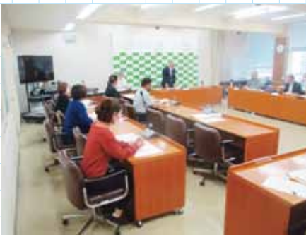
▲第1回委員会の様子（R3.5.20）

市民アンケートやワークショップなどの市民の皆さまからのご意見なども委員会で検討し、提案内容に反映されます。今年度、10回程度の開催を予定している委員会の審議を経て基本構想・基本計画を策定していきます。