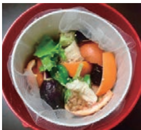
生ごみを処理機に投入