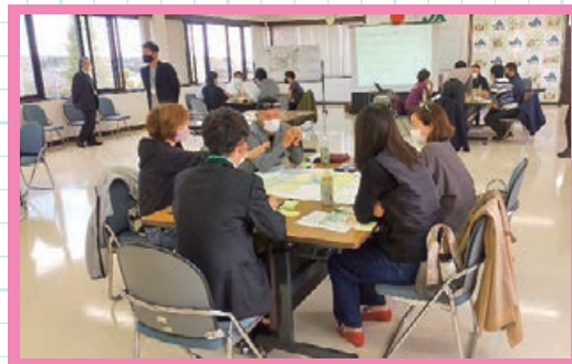
第1回市民ワークショップの様子 (R4.11.20 JA南さつまふれあいセンター)