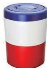
電動生ごみ処理機