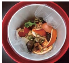
水分がなくなりパリパリに！