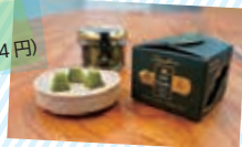
茶楽 (24pic 1,944円)