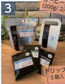
3 コーヒー豆グアテマラ (200g/ 2,462円)