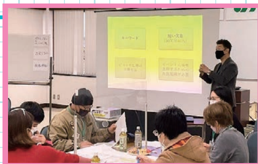
第2回市民ワークショップの様子 (R5.1.22 JA南さつまふれあいセンター)