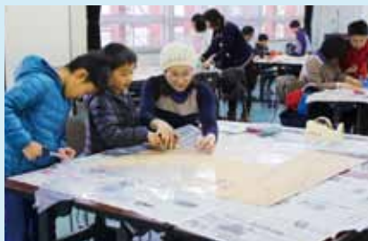
ふるさと体験学級茶レンジ隊 「親子でたこ作り」