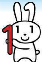
マイナンバーロゴ 「マイナちゃん」