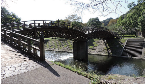
架け替え予定の平安橋

～審査の中で～ 岩屋公園管理費の平安橋架け替えについては、地域住民の意向にも耳を傾け、安心・安全な橋造りのもとより、岩屋公園の整備コンセプトや歴史的背景を考慮し、景観等への配慮も十分検討すること。