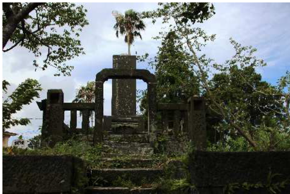
郡地区公民館の裏。