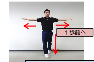
両手をひろげ胸を張る