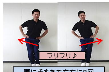
腰に手をあて左右に2回