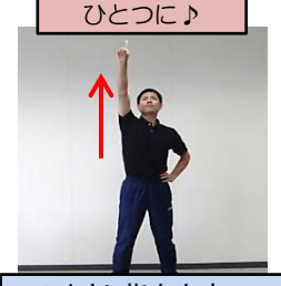
ひとさし指を大空へ