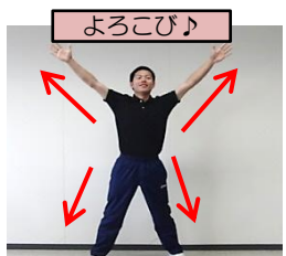
ジャンプをしながら