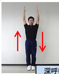
深呼吸をしながら