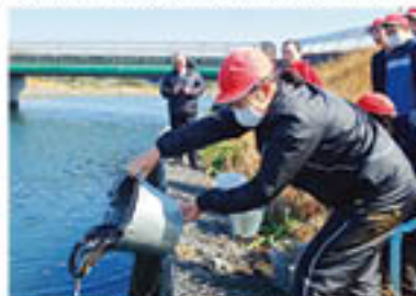
▲須賀町鰻種苗採捕組合長は「次の世代の子どもたちにもこのような体験をしてほしい」と話しました。

3月17日に南九州市須賀町鰻種苗採捕組合が、須賀町御領の馬渡川でウナギの放流を行いました。同組合は、資源増殖のため毎年この放流活動を行っています。当日は、九玉小学校6年生の児童たちが「無事に親ウナギに育てほしい」と願いを込めて大切に放流しました。