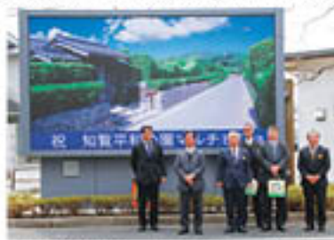
▲知覧平和公園マルチビジョンの前に立つ、日亜化学工業（株）と関係者の皆さん。

知覧町永里に工場を持つ日亜化学工業（株）よりLED映像表示装置が市に贈られ、3月27日、知覧文化会館で贈呈式が開催されました。この装置は知覧平和公園に設置され、「知覧平和公園マルチビジョン」として、来場者に美しい映像と共に市の情報をお届けします。