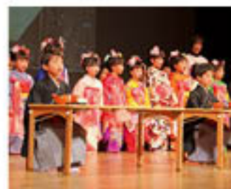
▲元気よく華やかに茶育の研究発表をする知覧中央保育園の園児たち。

また、同日の午後「第9回南九州市茶業振興大会」が、知覧中央保育園児による舞踊と茶育研究発表のオープニングで和やかに開催され、茶業功労者や茶品評会上位入賞者への表彰などが行われました。終盤には「茶銘柄統一による団結、信頼される茶産地づくり、世界に向けた日本茶の情報発信、次世代へつなぐ茶業経営の確立」を大会宣言し、盛大な拍手で採択されました。