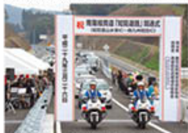
▲川辺高校・知覧中学校合同吹奏楽部の演奏に昇送された通り初め式。

3月26日、知覧金山水車インターで南薩縦貫道「知覧道路」開通式が開催。多くの関係者が出席し、知覧無双太鼓隊や川辺高校・知覧中学校合同吹奏楽部の演奏も披露され、待望の全線開通を祝いました。今後、南薩地域のさまざまな面での貢献に期待されます。