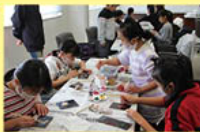
ふるさと体験学級茶レンジ隊 「ふるさとの伝統工芸 蒔絵を学ぼう」