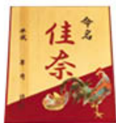
▲出生祝い品 命名プレート