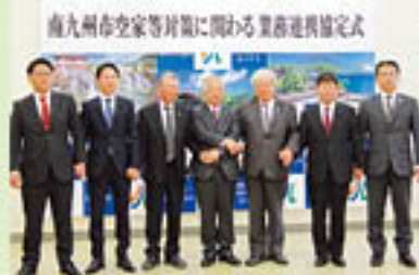
▲各金融機関と協定締結後、握手が交わされました。

3月30日、市は市内の6つの金融機関（JA 南さつま、JA いぶすき、(株)鹿児島銀行、(株)南日本銀行、鹿児島相互信用金庫、鹿児島信用金庫）と空家等対策事業に関わる業務連携協定を締結しました。内容は、危険空家の除却に対する相談・支援など、空家対策等事業が円滑に行えるよう共に連携・協力することで、より住みやすい環境を目指すためのものです。