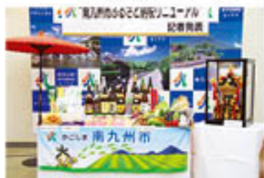
▲ふるさと寄附金の返礼品