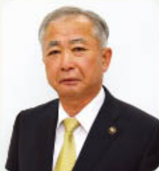
南九州市長 塗木 弘幸

平成29年度は地方交付税の合併算定替えから漸減措置期間3年目を迎え、財政的に厳しい状況が続く、人口減少や少子高齢化の進行への対応は待ったなしの最重要課題となっています。