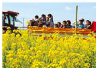
▲菜の花の香りを楽しみながらトラクター散策。子どもたちも手を振りうれしそうでした。

3月12日、知覧町塗木自治会内で「塗木菜の花まつり」が開催。辺り一面に広がる菜の花畑では、毎年恒例のポニーレースやトラクターによる散策が行われ、昼食時には知覧中央保育園児による太鼓や鹿児島市平川の方によるフラダンス、薩南工業高校吹奏楽部の演奏などがまつりを盛り上げました。