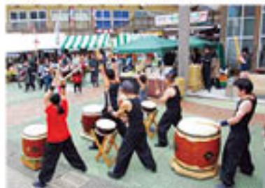
▲かわなべ産産仏太鼓保存会の演奏がイベントに華を添えました。

3月19日、「春のうまかもん市」が、道の駅川辺やすらぎの郷で開催されました。知覧茶、さつまいも、かわなべ牛など、さまざまな地元特産品が販売され、大勢の買い物客で賑わいました。また、お茶の手もみなどの体験コーナーも設けられ、多くの方に好評でした。