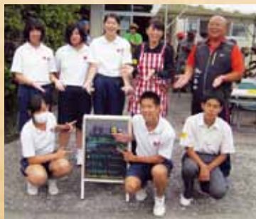
▲颯娃高校の生徒がボランティアに参加。今日のメニューと支援していただいた方が一目で分かるよう示しました。