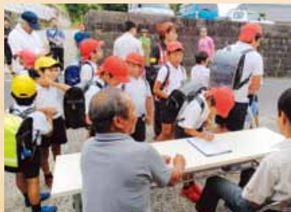
▲小学校の帰りに「そよ風ランチ」に参加する子どもたち。

◀10月14日、南組自治会公民館で第1回目の「そよ風ランチ」が開催。小・中・高校生、近隣自治会住民、そてつ会、更生会、当日ボランティアなど合わせて約100人が集まり、楽しいランチの時間を過ごして交流を深めました。