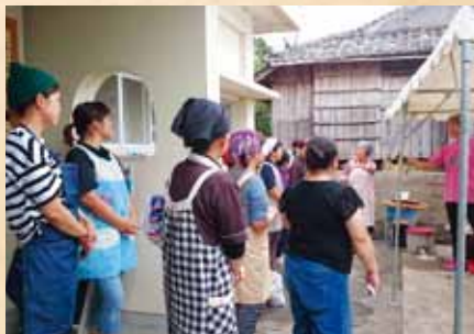
▲ボランティアスタッフのミーティング。ランチの流れをスタッフで共有します。