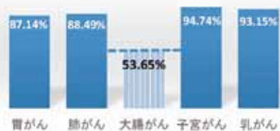
平成29年度 精密受診率(%)