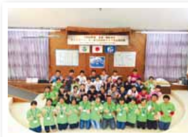
南薩・北薩 J・L・C 交流