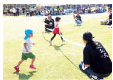
市民体育大会でボランティア