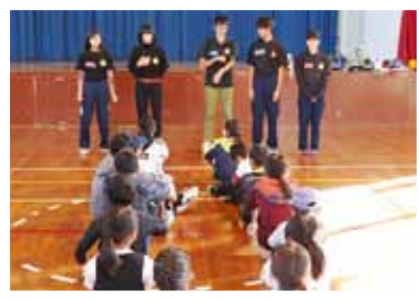
子ども会ヘレク紹介