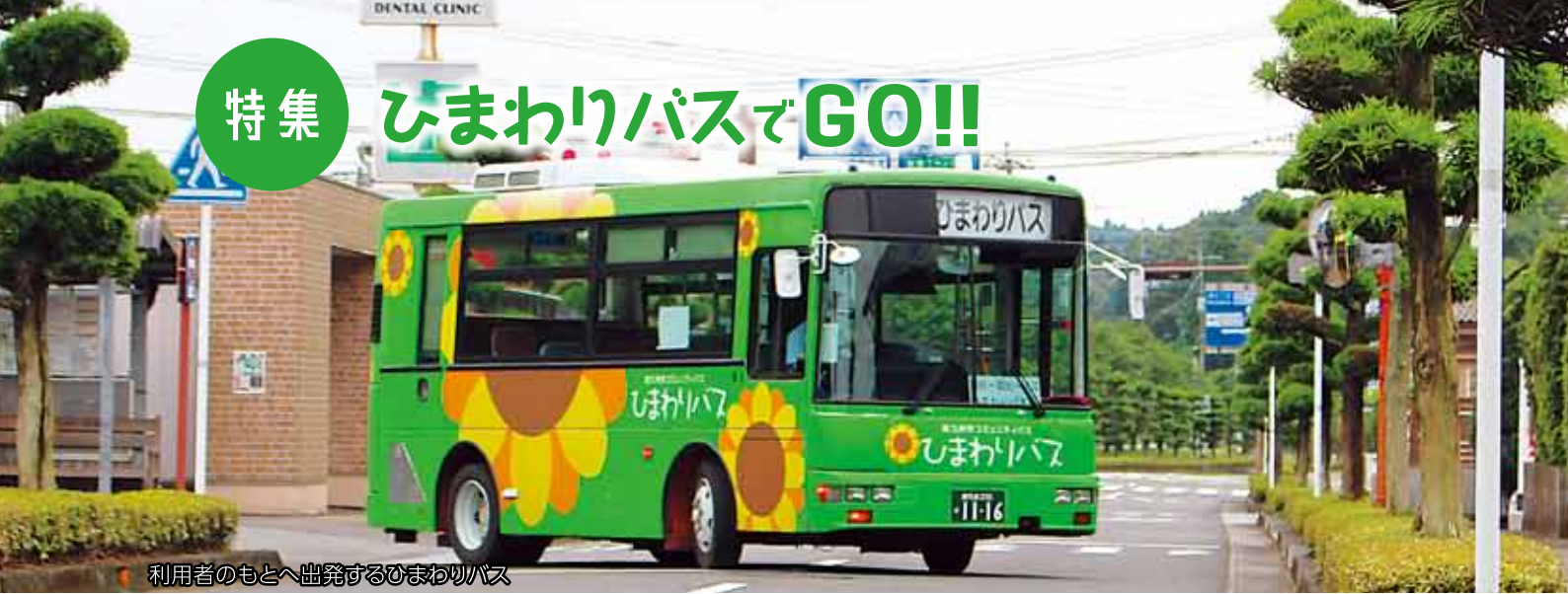
利用者のもとへ出発するひまわりバス

皆さん、「ひまわりバス」をご存知ですか。グリーンにひまわりのイラストがラッピングされたバスや、ジャンボタクシーなど、さまざまな車両が市内を走っています。利用したことはなくても、どこかで見かけたことはあるという方は多いのではないのでしょうか。