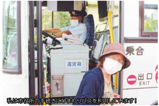
私は市役所の手続きにひまわりバスを利用しています!