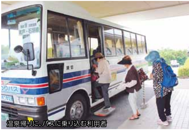
温泉帰りに、バスに乗り込む利用者