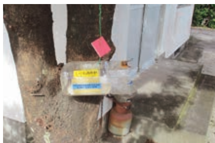
▲フェロモン剤が入ったトラップ