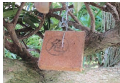
▲誘殺板 ※「危」の印字あり