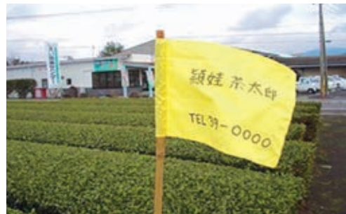
▲収穫前には「お知らせ旗」を設置します