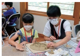
陶芸体験を楽しむ親子 ～ふるさと体験学級「茶レンジ隊」～

☆地域で、自然体験活動、郷土芸能活動などの体験活動を展開し、地域ぐるみで子どもたちの学びや成長を支えましょう。