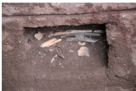
清水磨崖仏の火葬骨