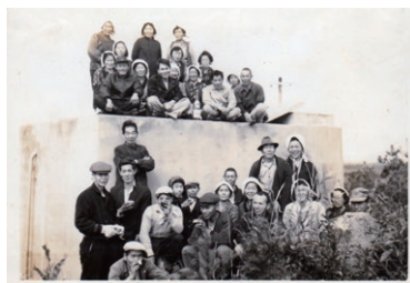
新田上水道配水池（推測）（昭和30年代推定）

浮辺地区では、地域の歴史を「浮辺の記憶」として未来につなげるため、「昭和100年浮辺の記憶事業」に取り組んでいます。この事業では、古い写真や動画をデジタル化し、地区公民館のホームページで公開しています。ホームページ上に新設された専用メニューには、令和4年に閉校した浮辺小学校の「閉校記念誌」に集められた写真や地域の伝統行事、昔の日常生活を捉えた貴重な写真も掲載されています。