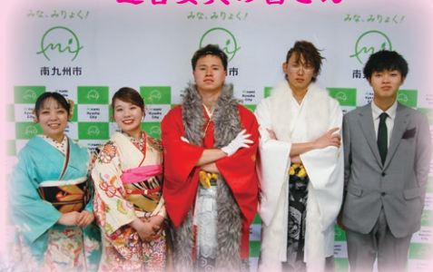
運営委員の皆さん