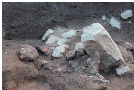
宝光院跡の鍛冶炉遺構