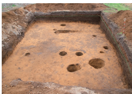
河辺氏居館跡の柱穴