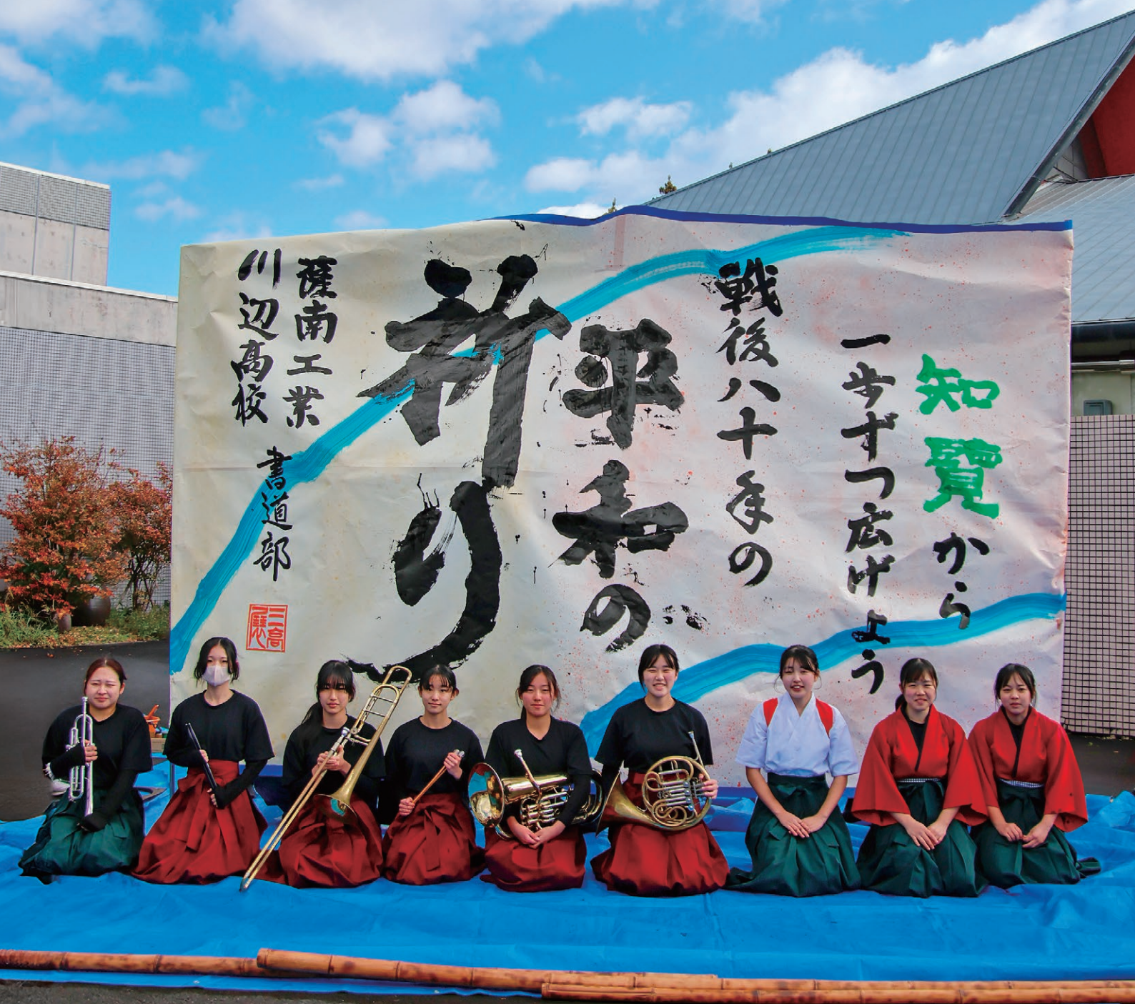
市内高校生による新春書初めパフォーマンス