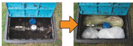
水道メーターの保温