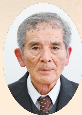
南九州市議会議長