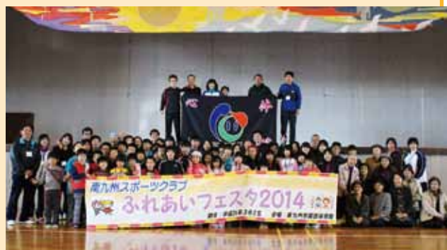
▲ふれあいフェスタ 2014 の参加者とスタッフ。