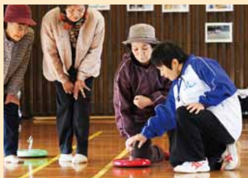
▲ニュースポーツの1つ、カロリング。ふれあいフェスタで体験中。