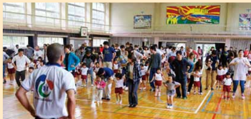
▲川辺幼稚園の依頼を受けて親子ふれあい教室を開催しました。100人近くの園児と保護者が参加しました。

また、年に1回ふれあいフェスタを開催し、楽しみながらさまざまなスポーツが体験できるこのイベントは、たくさんの参加者でにぎわいます。