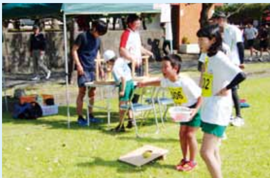
えい新茶・大野岳マラソン大会でのニユースポーツ教室

スポーツ推進委員は、市主催のイベントなどでニユースポーツ教室を開催し、市民がスポーツに触れ合う機会を作ります。